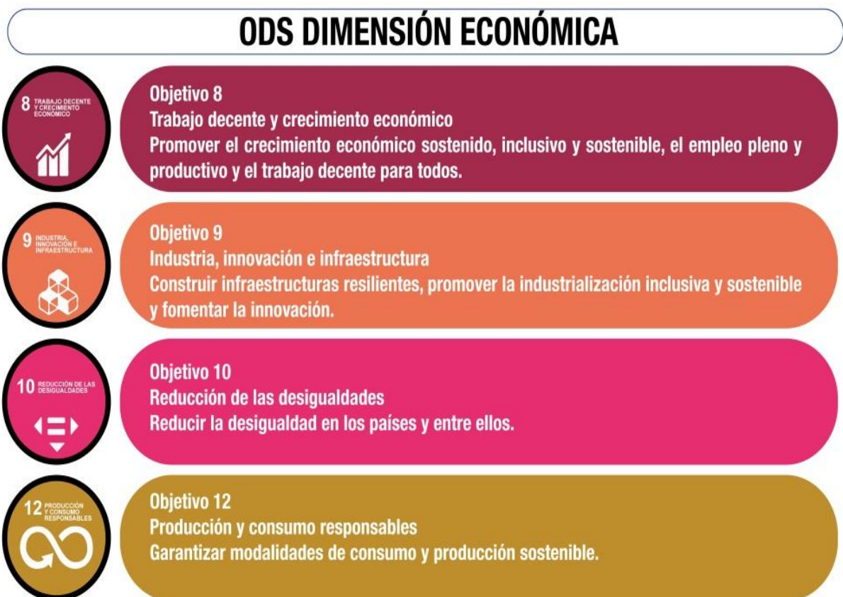
Figura 2. Dimensiones de los ODS

De esta manera se presentan las 4 dimensiones en las que se estructura la agenda científica del congreso y las diferentes áreas y disciplinas en las que se pueden abordar el estudio de los ODS. Por lo tanto las investigaciones que se presentan deben estar alineadas a esta propuesta de trabajo colaborativo.